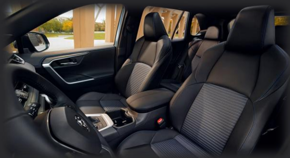
صندلی‌های جلو چرم مشکی با دوخت الماسی، تنظیم برقی و پشتی گرم