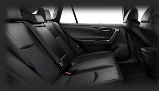
صندلی‌های عقب نیمکت سه نفره با دوخت مورب