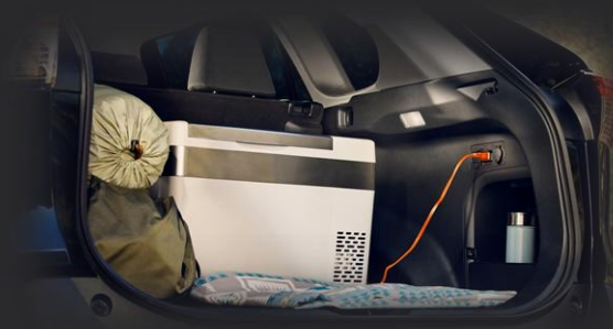
فضای بار گسترده با درب صندوق برقی

پانل داخلی مشکی با دوخت هماهنگ با فضای کابین