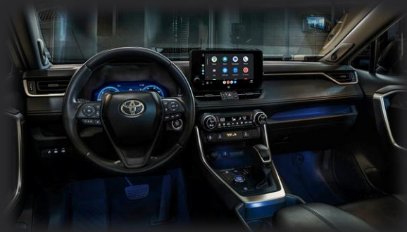
داشبورد و کنسول مرکزی نمایشگر ناوبری ۱۰.۲۵ اینچ با نقشه آنلاین و دوخت اختصاصی