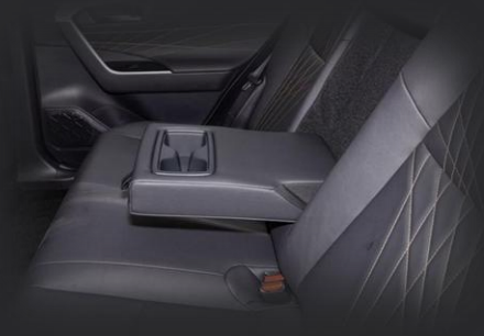
دسته دست عقب

دسته دست مرکزی تاشو با دو جاکاپ برای راحتی سرنشینان عقب