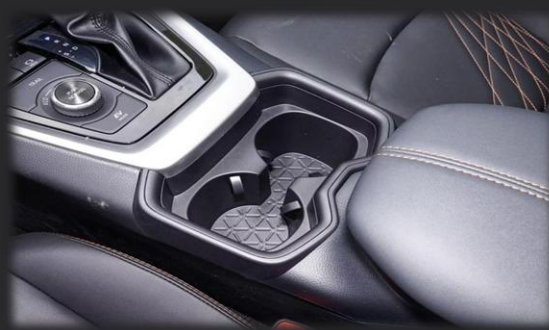
کنسول مرکزی جاکاپ دوتایی، دکمه‌های کنترل و دنده با روکش چرم